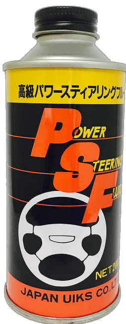
200ml×25本 (1ケース) コードNo.403 (赤)